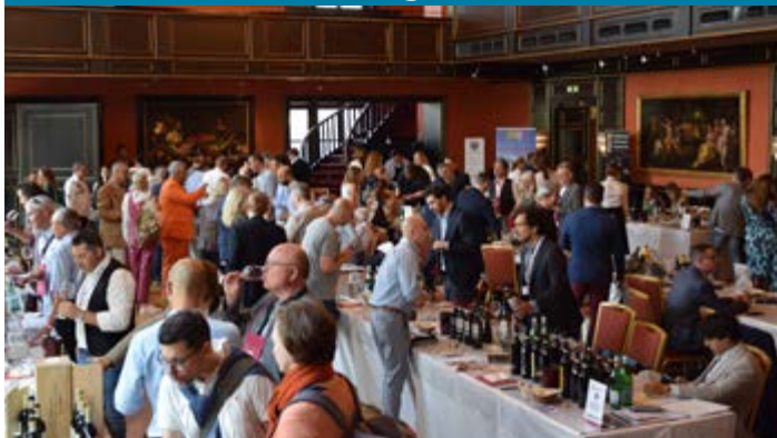
60 aziende enogastronomiche