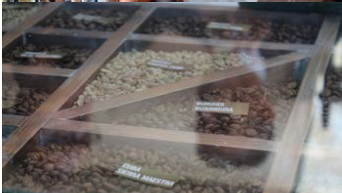
Seminari di caffè