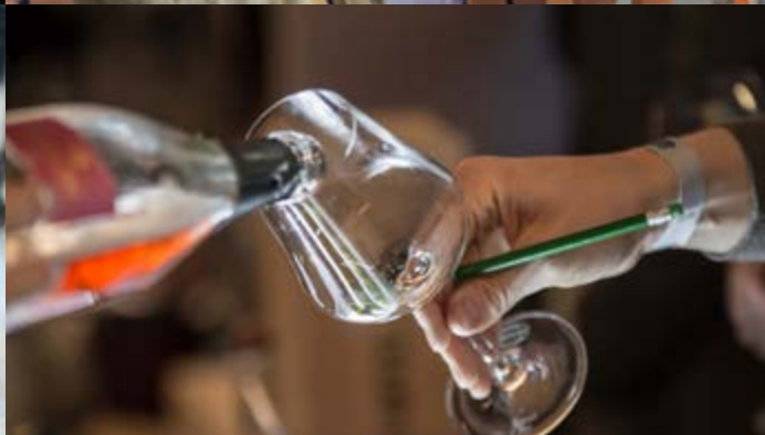
Percorsi di degustazione vino